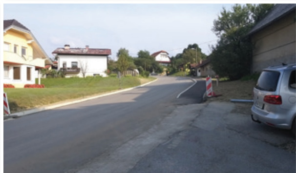
Obnovljena regionalna cesta in nov pločnik v Brengovi

njej pretočna za promet, ki ga ni malo. Julija in avgusta so potekala tudi obnovitvena dela v središču Cerkevjaka, kjer bodo uredili nov trg, ki bo naselju dal trški videz oziroma podoba. V času, ko so prenavljali in urejali nov trg v centru kraja, je bil otežen dostop do trgovin, pošte, občine in lokalov ob njem. Zato so prenavo trga časovno umestili v čas, ko je največ ljudi na dopustu in je promet v središču naselja in občine najmanj intenziven.