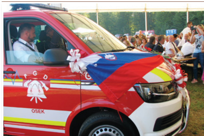
Po opravljeni svečani predaji novega vozila so se na preizkusno vožnjo popeljali tisti, ki jim gre največja zasluga, da so oseški gasilci prišli do novega avtomobila.