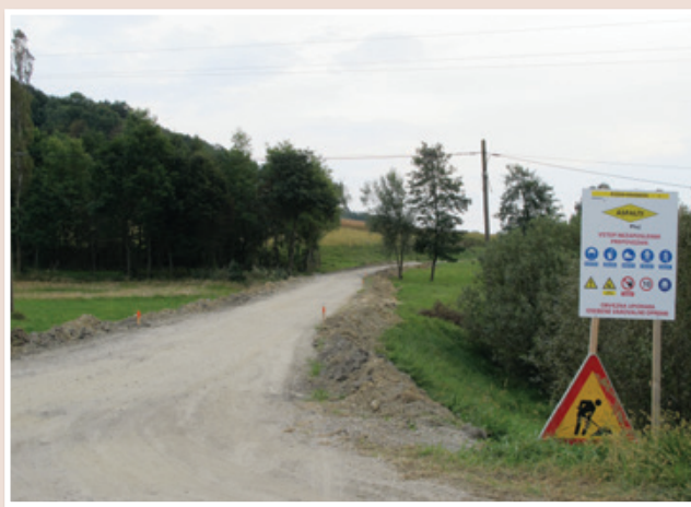
Občine upravljajo le z lokalnimi cestami in javnimi potmi (po dolžini je teh največ), medtem ko so za vzdrževanje in modernizacijo vseh drugih cest odgovorni bodisi na Direkciji Republike Slovenije za infrastrukturo ali na Družbi za upravljanje avtocest (DARS).