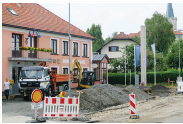
V poletnih mesecih se je središče Občine Cerkevjak spremenilo v gradbišče, saj so prenavljali regionalno cesto skozi Cerkevjak ter na novo urejali trg v njegovem središču.