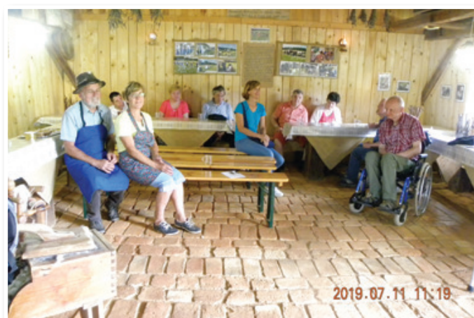
Pa smo šli "k njim na tavr" – obisk Ekološke kmetije Pri Fridi