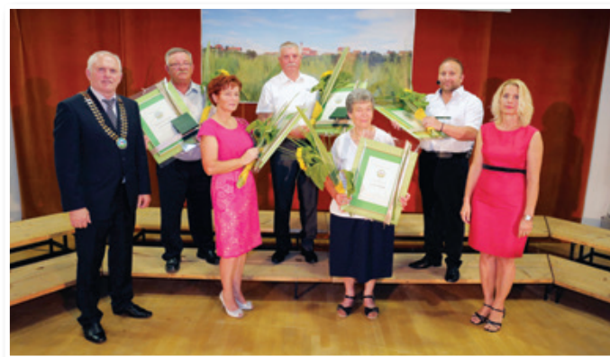
Prejemniki občinskih priznanj, foto: Marjan Dvoršak

Župan je na koncu opozoril, da h kakovostnemu, lepemu in bogatemu življenju v Občini Sveta Ana s prostovoljnimi delom veliko prispevajo tudi društva in organizacije, ki delujejo v občini. To dokazuje tudi bogat program praznovanja občinskega praznika, saj so se v njegovo načrtovanje in izvedbo vključila domala vsa društva in organizacije v občini.