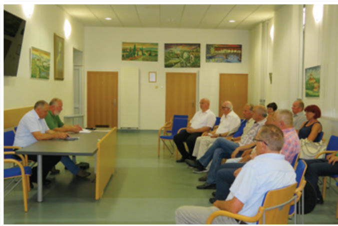
Na okrogli mizi ob jubileju Slovenskogoriškega foruma so njegovi člani ovrednotili njegovo delovanje in rezultate dela foruma v minulih 20 letih.