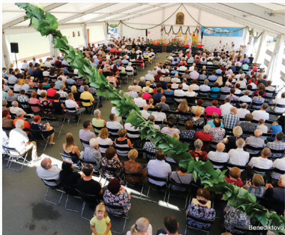
Po dogodkih zajeten praznik Občine Benedikt – Benediktovo 2019 – je potekal od 28. junija do 13. julija. Eden osrednjih dogodkov je bilo farno žegnanje.