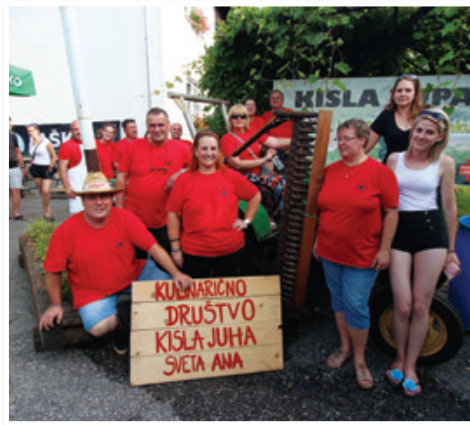
Kuhanje kisle juhe