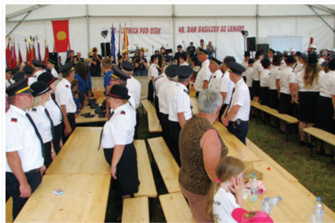
Slovesnost pod velikim šotorom se je začela z državno in zatem še gasilsko himno.