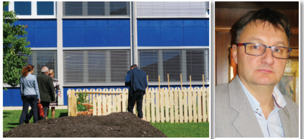
Kmečki vrt si je ogledala tudi ministrica za kmetijstvo, gozdarstvo in prehrano dr. Aleksandra Pivec.

dnjih Slovenskih goricah. Prav tako so uredili vzorčni sadovnjak, v katerem so zasadili deset sadik sadnega drevja, saj v preteklosti v Slovenskih goricah skoraj ni bilo domačije, okoli katere ne bi raslo sadno drevje. Tako si bodo lahko obiskovalci ti dve značilnosti osrednjih Slovenskih goric – brajde in sadovnjak – ogledali kar v središču Benedikta, saj