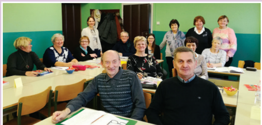
Nemška študijska skupina (šol. l. 2018/2019)

T: 02 720 78 88 ali 051 368 118, E: izobrazevalnicenter.slogor@gmail.com