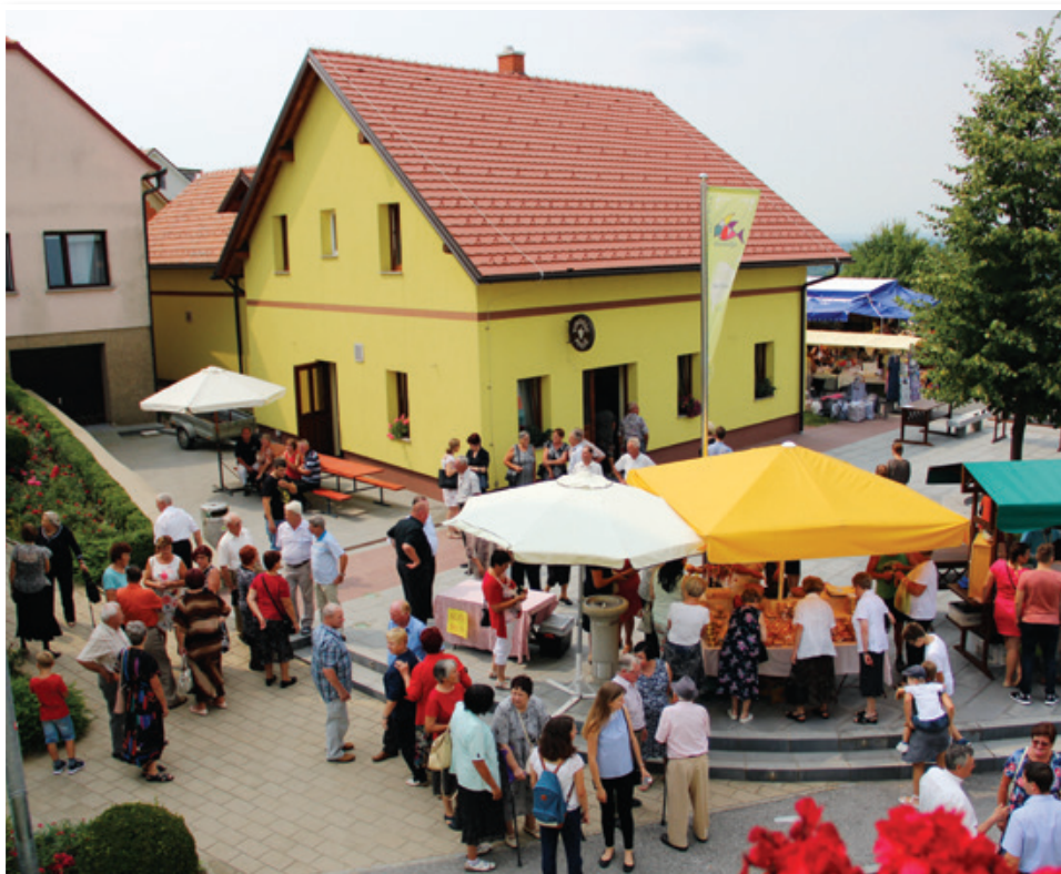
Anin teden, sicer več kot teden dni dolga vrsta prireditev ob prazniku Občine Sv. Ana, se je zvrstil od 19. do 28. julija. Posnetek je nastal ob Anini nedelji.