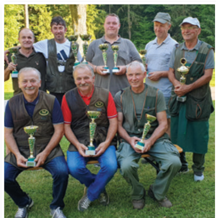
Zmagovalci Dobrave 2019.