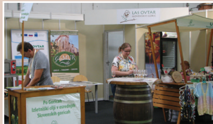
Stojnica LAS Ovtar na Agri 2019