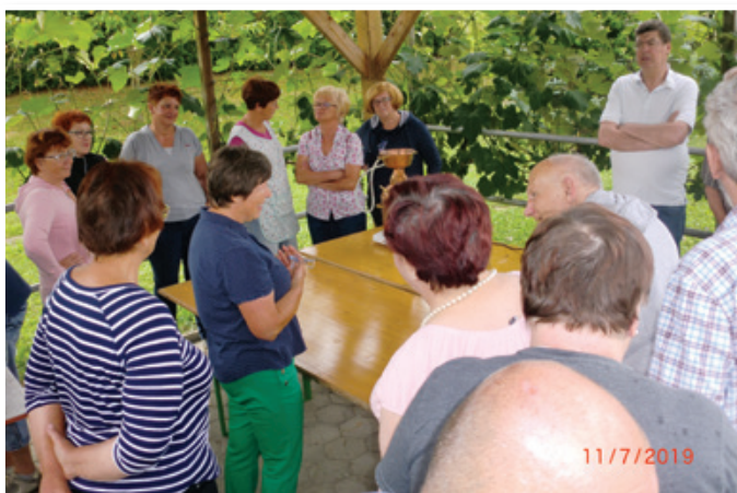
Poučen obisk članic zeliščarske sekcije, ki deluje v okviru KD Rojs Srečko Niko Voličina