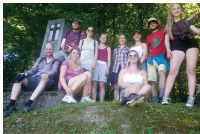
Udeleženci pohoda pri spomeniku Črni križ pri Hrastovcu.