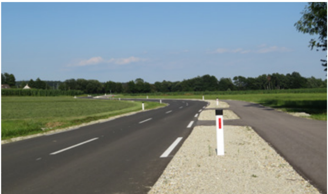
Ob cesti so zgradili tudi kolesarsko stezo, ki bo v Sveto Ano poleg domačih ljubiteljev kolesarjenja privabila tudi turiste na kolesih iz sosednje Avstrije.