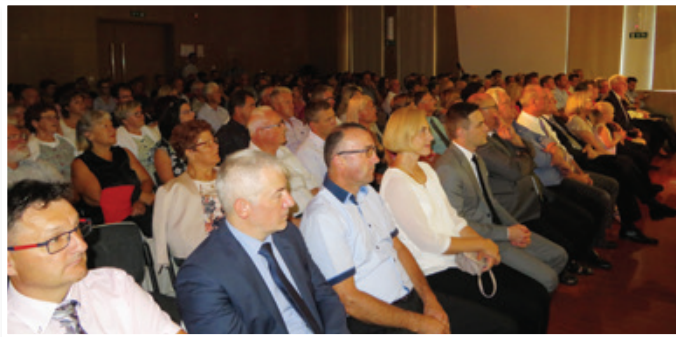
Osrednje proslave ob občinskem prazniku so se poleg številnih domačinov udeležili tudi ugledni gosti.