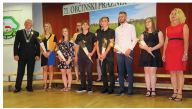
Najboljšim dijakom in študentom iz območja Občine Sveta Ana so podelili denarne nagrade.